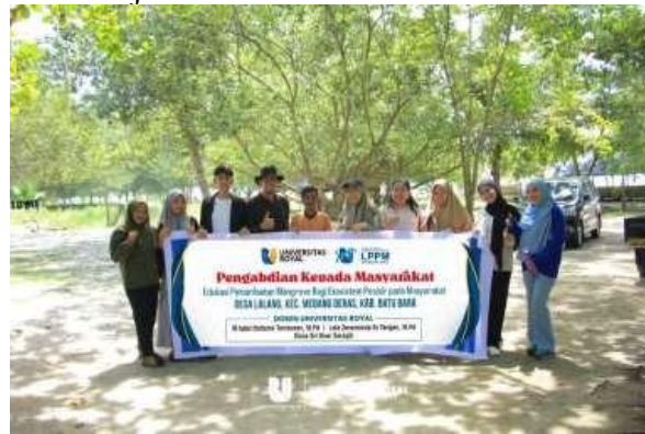
Gambar 4. Foto Bersama

Tahap ini meliputi kegiatan monitoring terhadap pertumbuhan mangrove yang telah ditanam untuk mengetahui tingkat keberhasilan penanaman. Selanjutnya dilakukan evaluasi terhadap seluruh rangkaian kegiatan guna mengidentifikasi keberhasilan dan kendala yang dihadapi. Sebagai tindak lanjut, dilakukan pendampingan kepada masyarakat agar mampu menjaga kelestarian mangrove serta mengembangkan pemanfaatannya secara berkelanjutan.